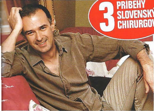
3 PRÍBEHY SLOVENSKÝCH CHIRURGOV

Chcem si domov kúpiť poriadnu striptízovú tyč